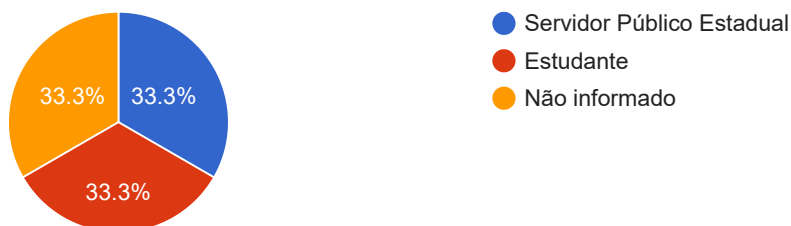
Solicitantes PF - Profissão