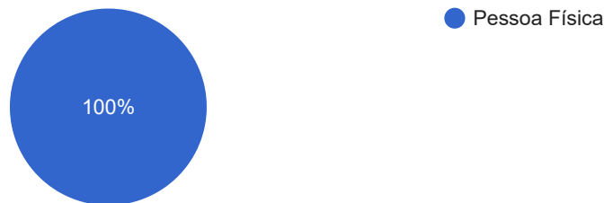
Solicitantes - Tipo de Pessoa